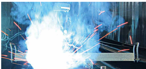
通常の炭酸ガスアーク溶接