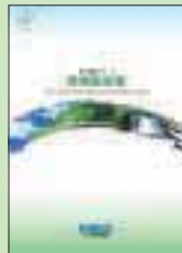
2005年度版 環境報告書