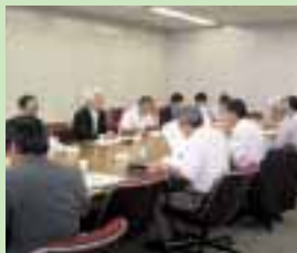
環境経営委員会(2005年8月開催)

神戸製鋼グループは、企業活動と地球環境との共生と調和を一層深めていくため、「環境先進企業グループ」を目指し、環境経営委員会のもと、6つの実施事項を柱として環境経営を推進しております。