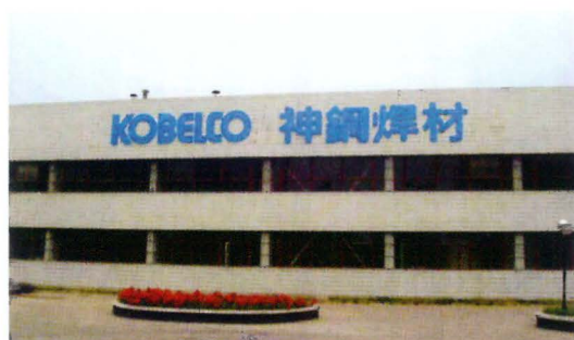
唐山神鋼溶接材料有限公司（KWT）

アルミ・銅部門については、半導体製造拠点の増加に対応する形で、銅板加工事業の中国進出が始まった。2004年9月には、当社グループ会社の神鋼リードミック株式会社が江蘇省無錫市にリードフレームの生産・販売会社「神鋼力得米克電子部件（無錫）有限公司」を設立した。さらに2005年5月には、当社の現地法人