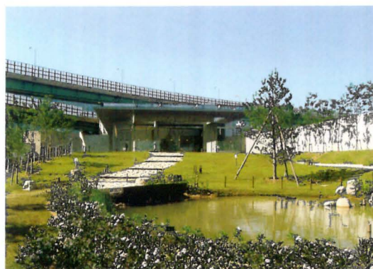
灘浜サイエンススクエア