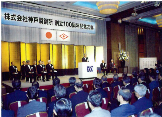
創立100周年記念式典