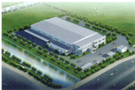
蘇州神鋼電子材料有限公司（完成予想図）