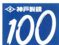
おかげさまで100周年 100周年 キャンペーンマーク

※大澤壽人氏は、当社創立時の社員 大澤壽太郎の子息で、昭和初期に活躍した新進作曲家であった。当社初代社歌の作曲を担当した。