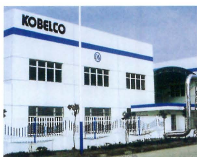
神鋼力得米克電子部件（無錫）有限公司