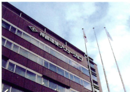
(株)神鋼環境ソリューション

両社が統合することで、プラントのプロセス設計からエンジニアリング、機器製作および調達、施工管理、メンテナンスまでを一貫して行う体制を確立し、神戸製鋼グループの総合プラント事