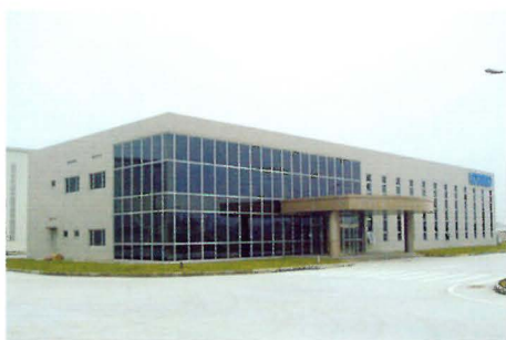
杭州神鋼建設機械有限公司（HKCM）

として電子材料用銅板スリット加工・販売を行う「蘇州神鋼電子材料有限公司」を設立した。