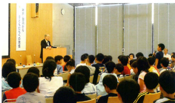
ノーベル賞受賞者野依良治先生の講演会

2005年7月18日、当社100周年記念事業の一環として、「未来を担う君たちへ」と題した、神戸市出身の2001年ノーベル化学賞受賞の科学者 野依良治先生の講演会を、「灘浜サイエンススクエア」および「神戸市青少年科学館（同時中継）」で行った。阪神・淡路大震災を乗り越え未来に向かって歩む子供達に、夢や希望を与え、科学への興味や好奇心を育んでもらうことを目的としたもので、地域との共生を図る当社にとって意義深いものであった。神戸市、神戸市教育委員会、「震災10年 神戸から