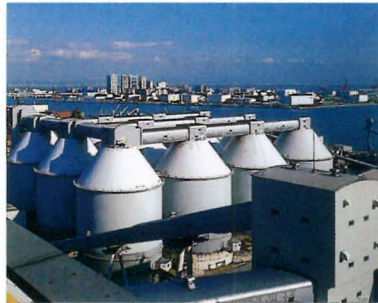
石炭サイロ、密閉式ベルトコンベア