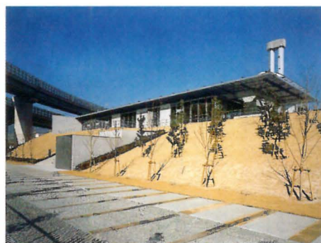
灘浜サイエンススクエア