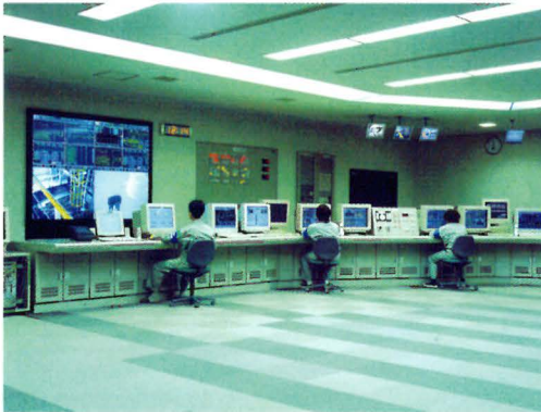
神鋼神戸発電所のコントロールセンター