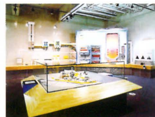
発電とエネルギーゾーン

給しており、蒸米工程のほか、洗瓶・火入れ（殺菌）・タンク洗浄など多目的に使用されている。酒造会社にとっては従来のように重油を使用するボイラの設備を保有する必要がなくなり、メンテナンスが不要になるとともにエネルギーの有効利用と地域全体での環境負荷（重油→蒸気）の低減にもつながっている。