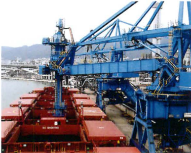
連続密閉式アンローダ