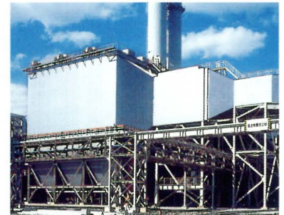
電気式集じん装置