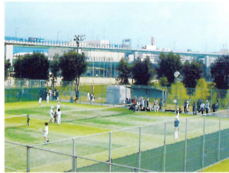
灘浜スポーツゾーン