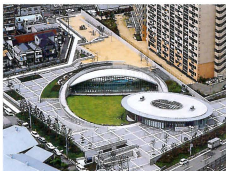
灘浜ガーデンバーデン