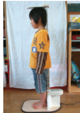
① 贈られた身長計で身長を測る子どもたち(東広島市)