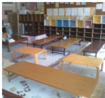
① テーブル、棚、マットを寄贈した(高砂市)