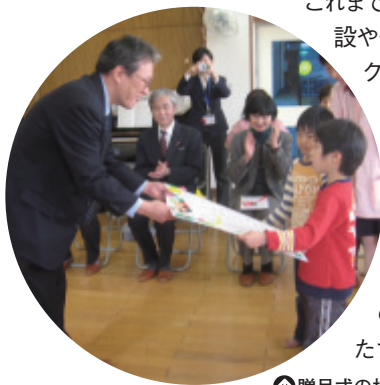
①贈呈式の様子(下関市)

これまでの支援内容は、児童養護施設や子育て支援施設にアスレチックマットや乳幼児用身長計などの遊具・備品の贈呈、子どもたちによる公園への植樹活動の支援、子どもの安全を守る活動として「子ども向け 川の安全ハンドブック」や防災マップの制作費の助成などです。また、子どもたちが日本の伝統文化に親し