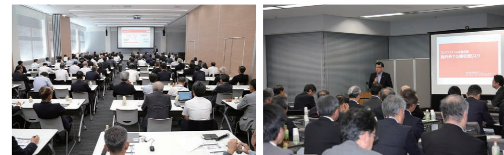
以2019年10月启动的“合规高层研讨会” “国内外行贿受贿风险”为主题，针对集团全体经营干部共185人实施该项调查

集团合规活动等的详细内容敬请浏览神钢集团网站。 https://www.kobelco.co.jp/english/about_kobelco/kobesteel/ethics-compliance/index.html