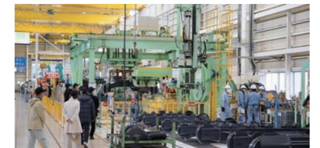
(上) 加古川制铁所、(下) 神钢建机株式会社五日市工厂