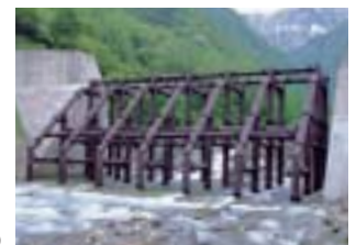
五十沢川砂防えん堤(新潟県)

格子形砂防えん堤は河川の水流を阻害しないため、平常時は無害な土砂を下流に流し、海岸線の後退や河床の低下を防いでいます。また、格子形砂防えん堤は魚などの自由な往来を妨げないため、水棲生物の生態系の保全にも効果を発揮しています。当社では、格子形えん堤の更なる普及を目指し、大規模な格子形砂防えん堤の開発を推進しています。