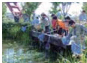
多様な生き物とふれあう観察会

灘浜サイエンススクエアでは、施設内にビオトープを設けて生物多様性の保全に努めるとともに、NPO法人や専門家と連携を図りながら、地域の子供たちを対象とした生き物の観察会などを定期的に開催しています。海岸の埋立地という厳しい自然環境にあるにも関わらず、このビオトープでは希少種を含む生態環境が再生できつつあり、地域の環境教育の場としても活用されていることなどが評価されました。当社は、このビオトープを、大切に守っていく考えです。