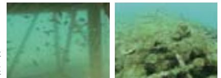
兵庫県姫路市沖に設置した魚礁の3ヵ月後(左)と6ヵ月後(右)の様子