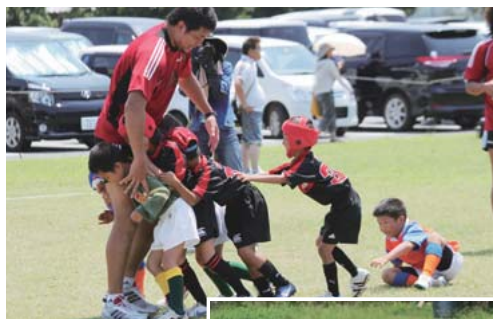
ラグビースクールの様子

神戸製鋼グループは、今後も、こうした活動を継続し、社会との共生を目指してまいります。