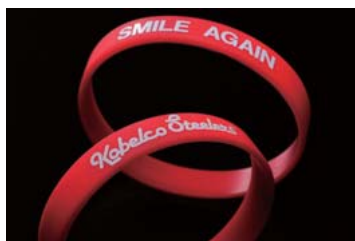
チャリティーリストバンド

平成13年度より行なってきた、特定非営利活動法人「日本せきずい基金」への募金活動をジャパンラグビートップリーグ2010-2011の神戸製鋼コベルコスティーラーズ出場試合会場にて引き続き行ないました。