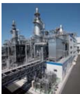
兵庫西流域下水汚泥広域処理場向け下水汚泥焼却・溶融設備

今回の受賞は、燃費の低減と温室効果ガス削減の両立を実現したことが大きく評価されたものです。