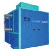
マイクロバイナリー MB-70H 外観

当社は今後も、省エネ・環境をキーワードに、様々なお客様へのエネルギーソリューションを提供してまいります。