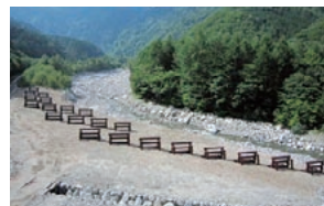
ブルメタル™設置例

当社では、今後も鉄構・砂防メニューの採用を通じ、自然災害による影響の低減や環境保護に取り組んでいきます。