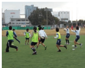
スペースボールを楽しむ子供たち

神戸製鋼グループは、今後も、こうした活動を継続し、社会との共生を図っていきます。