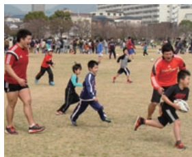
ラグビー教室の様子

このほか、地域住民やファンの方々との交流を深めるとともに、ラグビーを知らない方にラグビーの良さを伝え、ラグビーに興味を持っていただくために、地域のお祭りやトークショー等のイベントに選手が参加しています。今後も当社ラグビー部は、ラグビーを通じて地域・社会と積極的に交流を図り、多くの方々からラグビーの魅力を伝えていけるよう努力していきます。