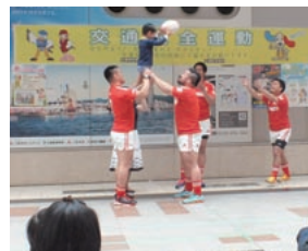
交通安全イベント参加時の様子