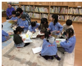
寄贈した絵本に読みふける子供たち