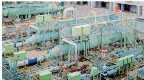
図2 中間媒体式LNG気化器 Fig. 2 Intermediate Fluid type LNG Vaporizer

Fig. 1 shows an LCM mixer-pelletizer system which is installed on polyethylene and polypropylene plants. Unstable polymer powder coming from the reactor is melted and mixed with additives in the mixer, and the homogenized product exits the pelletizer in the pellet form. Kobe Steel's continuous mixers, LCM series, have a gate mechanism and both end support design, which provide high quality mixing performance, wide controllability range and high mechanical reliability. LCMs have an excellent reputation and are used at about 50% of the world's polyethylene plants. The LCM is one of Kobe Steel's "Only-one" high end products.