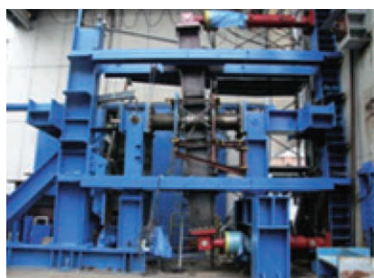
図1 建築構造実験用載荷装置 Fig. 1 Experimental loading equipment for studying building construction

Kobe Steel, in prompt response to customer needs, has been continually involved in the research and development of materials and application technologies for steel plate and steel sheet. This special edition introduces the latest developments at Kobe Steel regarding new materials and simulation technologies in steel plate for vessels, construction and bridges and steel sheet for automobiles and electrical appliances.