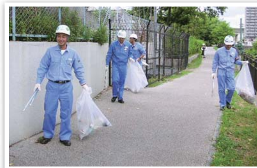
茨木工場 / Ibaraki plant