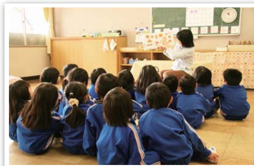
福知山工場 / Fukuchiyama plant