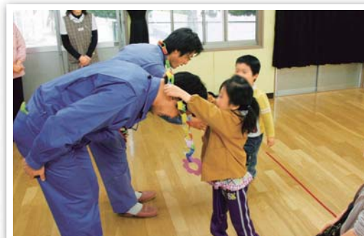
西条工場 / Saijo plant