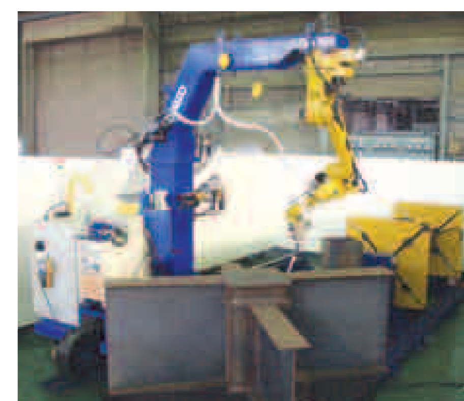
REGARC™ 鉄骨天吊 マルチワーク溶接システム