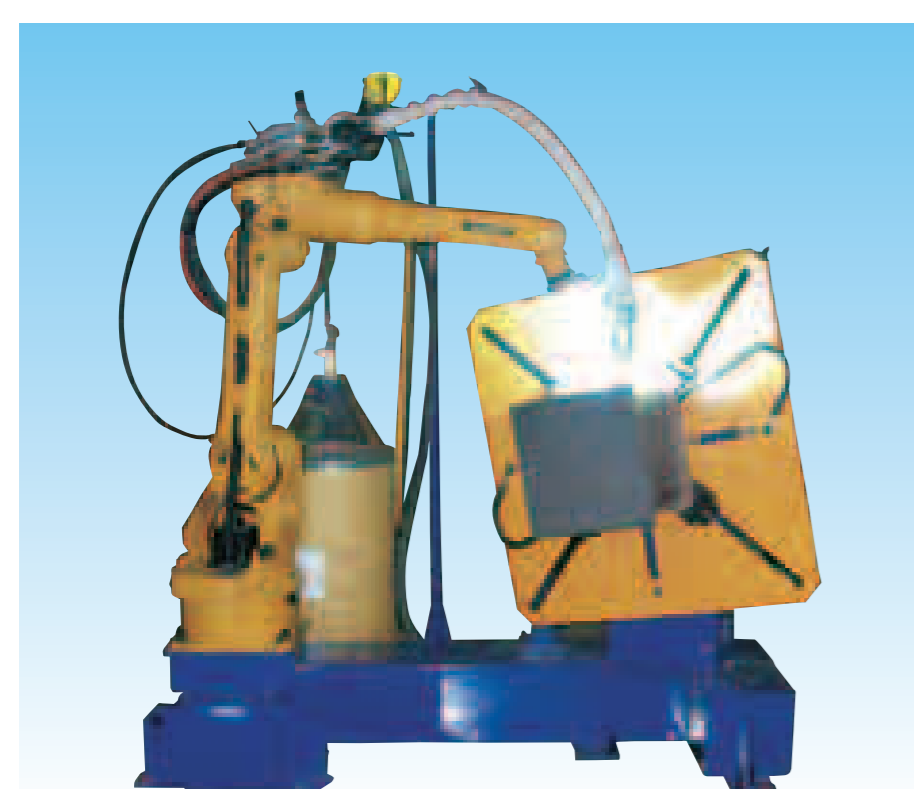
REGARC™ 省スペース型 鉄骨コア・仕口兼用溶接システム