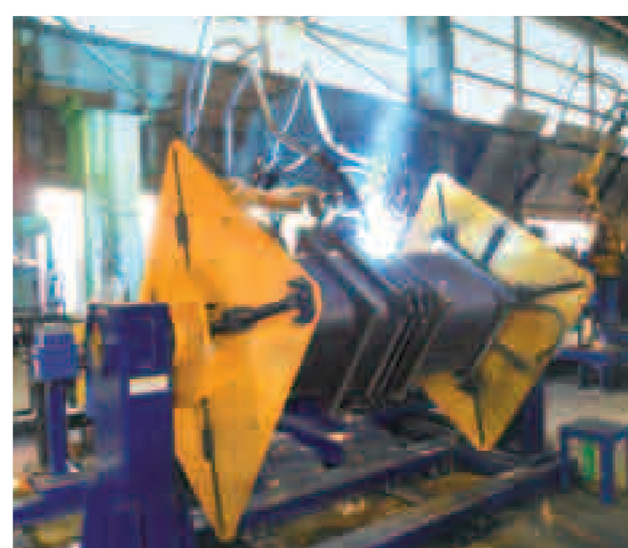
REGARC™ 鉄骨コア連結 2アーク溶接システム