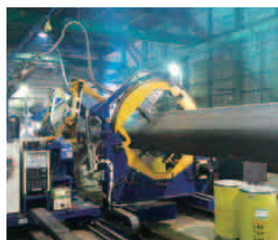
REGARC™ 鉄骨柱大組立 2アーク溶接システム