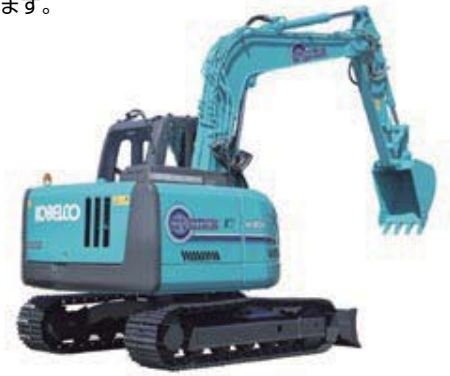
ハイブリッド油圧ショベル「SK80ハイブリッド」

2010年1月に、現行機と比較して40%燃費低減を実現した8トンクラスのハイブリッド油圧ショベル「SK80ハイブリッド」の販売を開始しました。「SK80ハイブリッド」は、住宅地などで活躍が期待できる都市型建設機械です。燃費低減、CO 2 排出量削減に加え、圧倒的な低騒音を実現しています。今後も、人と環境に優しい建設機械をつくり続けていきます。