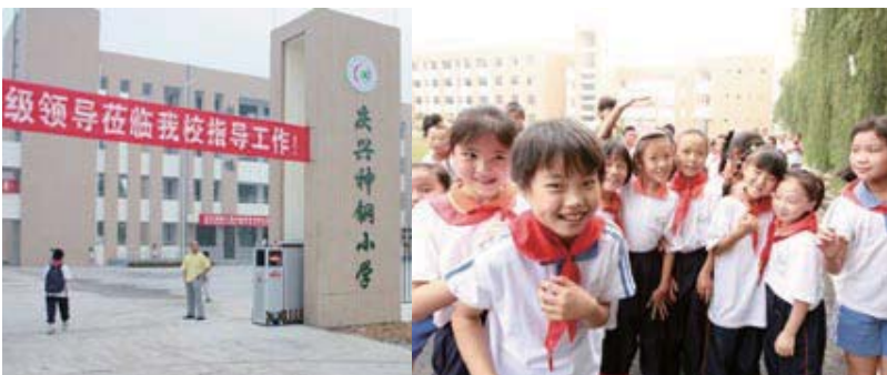
再建された「慶興神鋼小学校」。今後も成都市の復興を支援していきます。

コベルコ建機(株)と、コベルコ建機の中国合併会社である成都神鋼工程機械(集団)有限公司、成都神鋼建設機械有限公司の3社は、2008年5月の中国・四川省大地震で被災した小学校1校の再建を行いました。小学校は、2009年9月に無事完成し、現在は児童達が笑顔で登校しています。政府の意向により、小学校の名前には「神鋼」の文言が付けられました。今後も末永く交流を続けていきます。