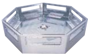
半導体・液晶製造装置用 アルミ製真空容器

アルミ・銅事業部門は、自動車およびIT関連産業向けを重点分野と位置付けて、当社特有の価値を持つ「オンリーワン製品」の強化と拡充を図っています。国内トップクラスのアルミ・銅メーカーとして、長年にわたり培ってきた技術と信頼をもとに、海外展開を強化しています。