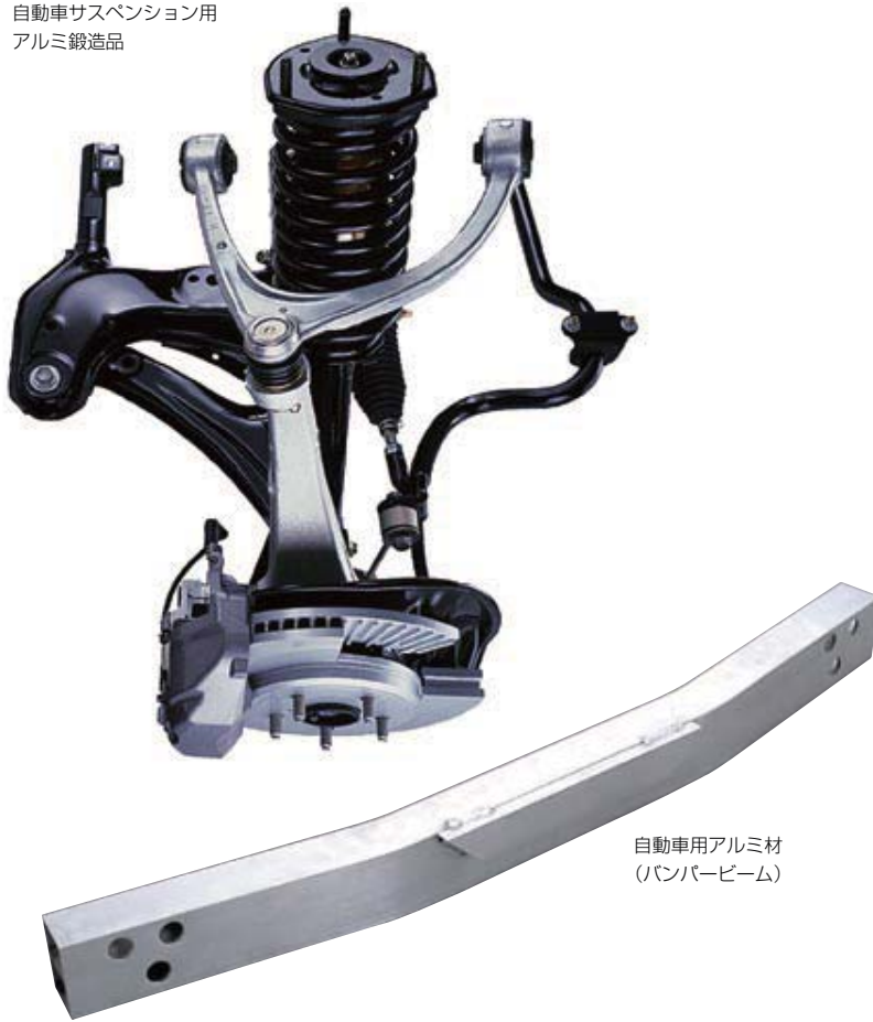
自動車用アルミ材 (バンパービーム)