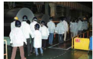
真岡製造所工場見学会の様子

製品展示室をご見学いただきました。当社といたしましては、より多くの株主様に当社グループの事業をご理解いただけるよう、今後もこうした活動に取り組んでまいりたいと考えております。