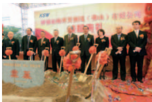
神鋼新確弾簧鋼線(佛山)有限公司 起工式の様子