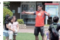
ラグビー教室の様子

今後も、当社ラグビー部は、普及活動を通じて、多くの方にラグビーの魅力を伝えていきたいと考えています。