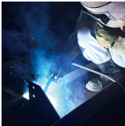
梁の水平すみ肉溶接 (溶接後に溶融垂鉛めっき処理)